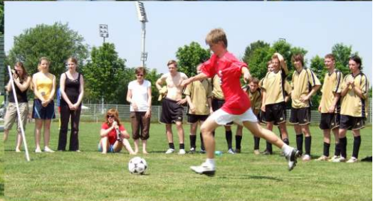
EC-Meisterschaften in Baunatal